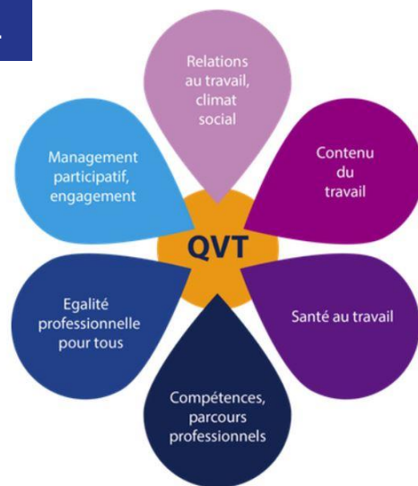
Les piliers de la QVT pour l'Anact (Agence Nationale pour l'amélioration des conditions de travail)

Ces indicateurs devront permettre aussi de détecter rapidement toute dérive liée à la mise en place du smart working sur le stress et la charge de travail des salariés d'AXA.